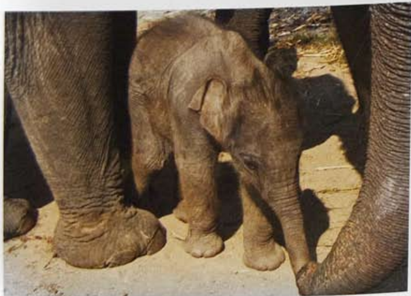
No Name zoekt contact met Sri Nuan.