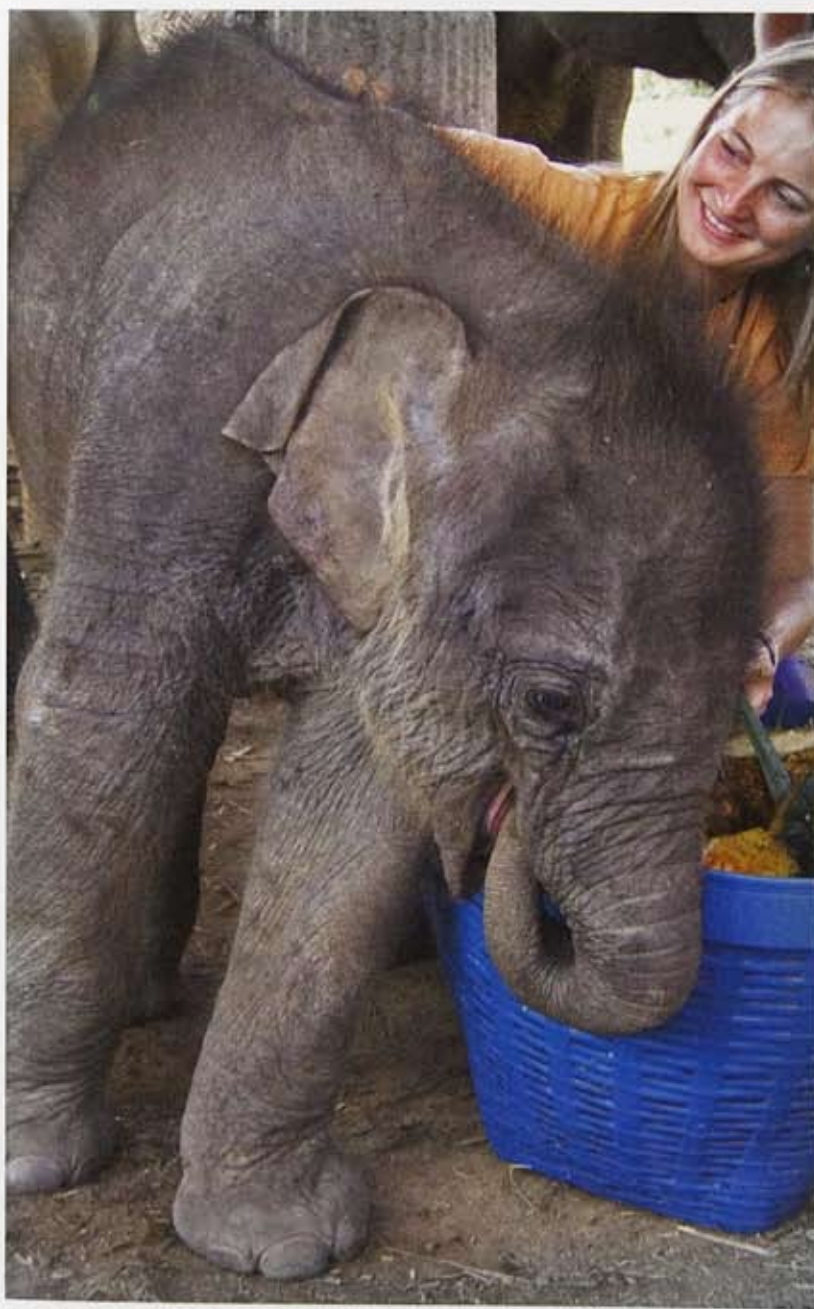
Antoinette en No Name.